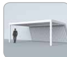
Fassadenmontage (2 Pfosten)