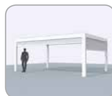
Kombination mit mehreren integrierten Fixscreen®