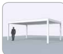
Freistehend (4 Pfosten)