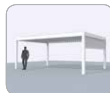
Spanseite mit integriertem Fixscreen®