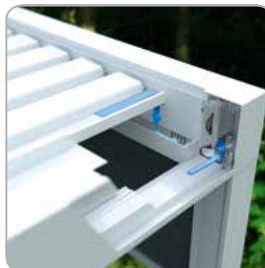
Effiziente integrierte Wasserabfuhr

Dank langjähriger Erfahrung mit textilem Sonnenschutz und Lüftung ermöglicht RENSON® eine beträchtliche Aufwertung des Außenbereichs. Durch sachgerechte Anwendung von Technik und innovativen Produkten ist der Aufenthalt im Garten nun auch in den Übergangszeiten möglich.