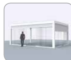
Pivot und/oder Spanseite mit Ganzglas - Schiebe-Systeme - wahlweise in Kombination mit integrierten Fixscreen®