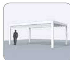
Pivotseite mit integriertem Fixscreen®

Wenn Sie Ihre Terrassenüberdachung teilweise mit Lineo® Luce - transparenten Lamellen - ausstatten, gelangt das angenehme Tageslicht bis in Ihre Wohnung hinein. Die Erweiterungen sind auch nachträglich perfekt zu integrieren.