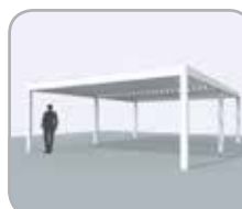
2-teilige Kopplung an Pivot- oder Spanseite möglich