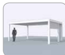
Pivot und/oder Spanseite mit integrierten Fixscreen® und Schiebetür realisiert mit Loggiascreen® 4FIX oder Loggiawood®