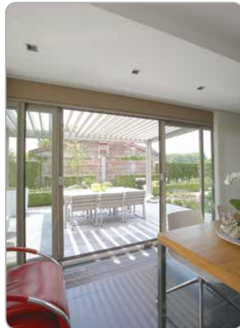
Integrierte windfeste Senkrechtmarkise realisiert mit Fixscreen®-Technologie