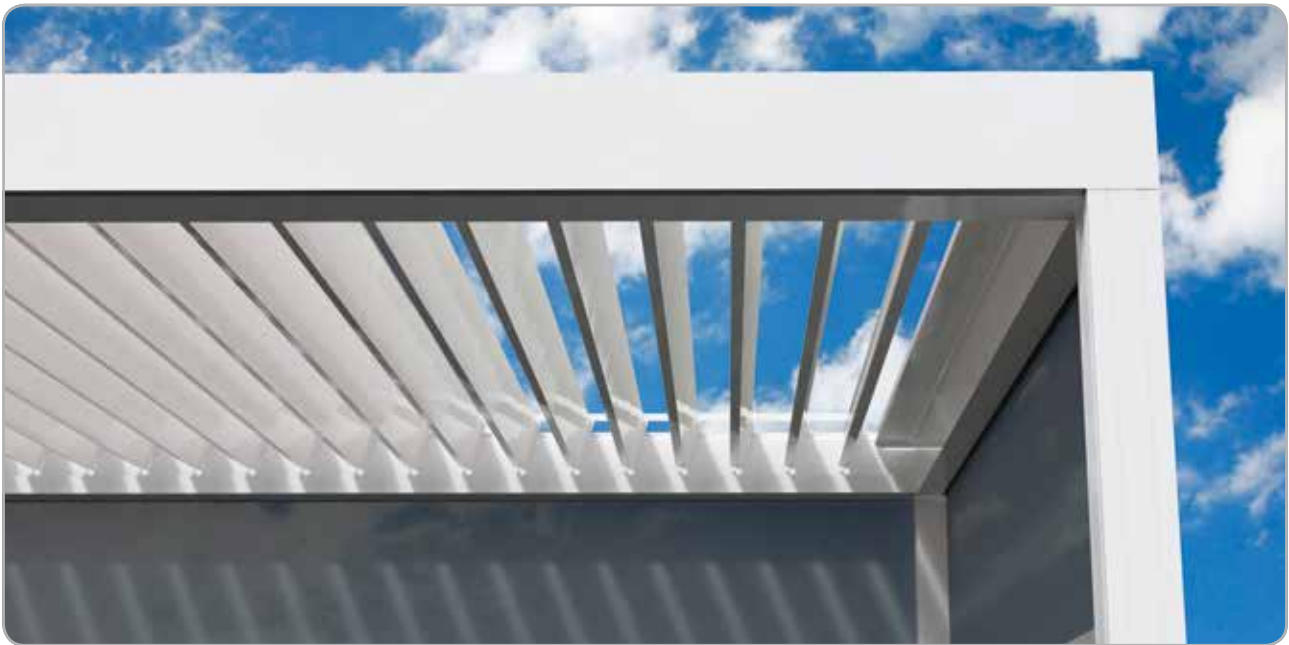
Im geöffneten Zustand: Sonnenschutz und Lüftung sind regulierbar