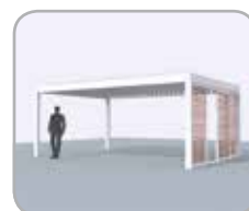
Spanseite mit Loggiawood® oder Loggiascreen® 4FIX