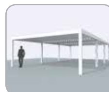
Mehrteilige Kopplung an Pivot- oder Spanseite