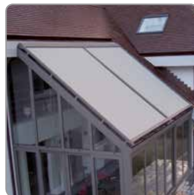
Montage couplé au-dessus de la véranda