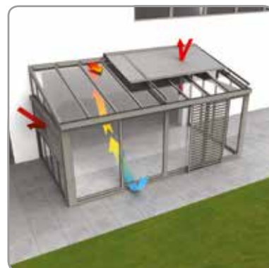
Healthy veranda concept®