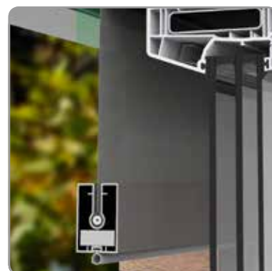
Détail de la barre de charge (sans soudure visible)