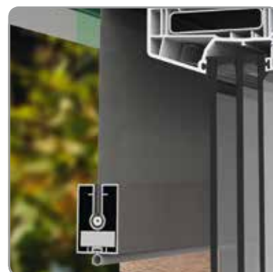
Détail de la barre de charge (sans soudure visible)