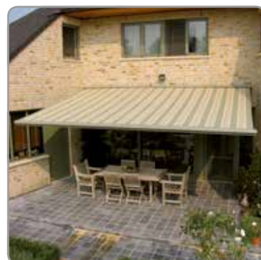
Vue de façade