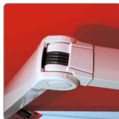
Détail du bras articulé