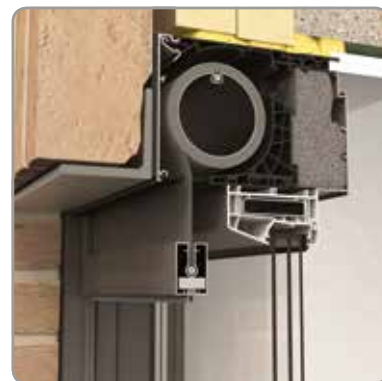
Außenansicht Fixscreen® Mono AK EVO