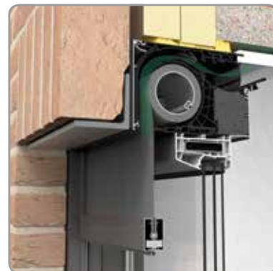
Innenansicht Fixvent® Mono AK EVO