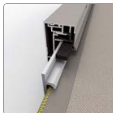
Détail système de guidage