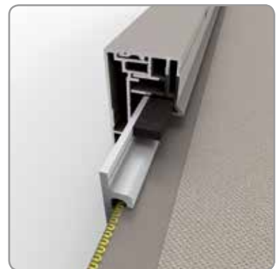
Detail des Führungssystems