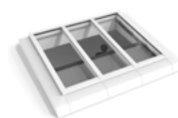
Caisson en bas (à l'intérieur)