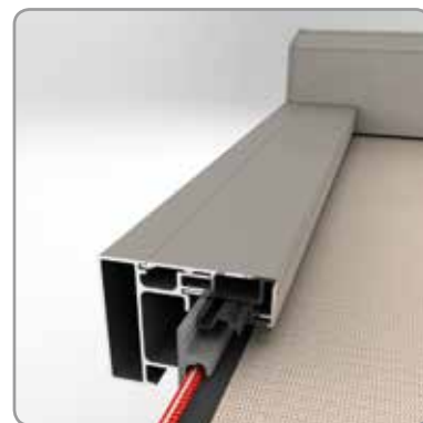
Coulisse: technologie Fixscreen®