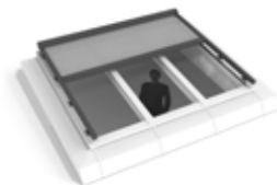
Caisson en haut

* Essais en soufflerie par le Von Karman Institute : n° EAR0852