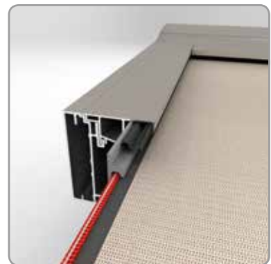
Coulisse : Fixscreen® technology