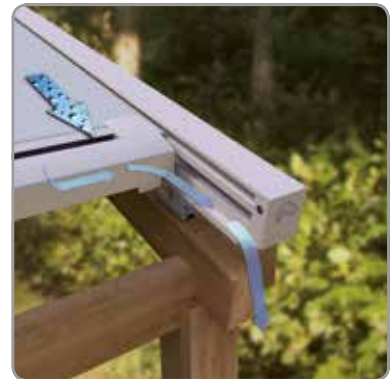
Evacuation d'eau intégrée