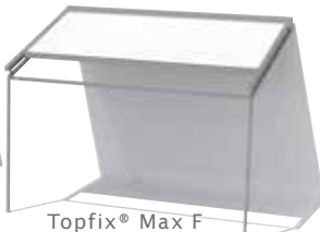
Topfix® Max F