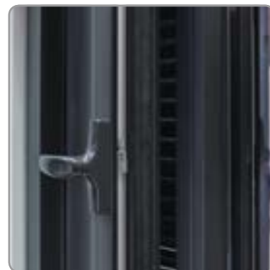
Detail geopende deur met Nightcooling