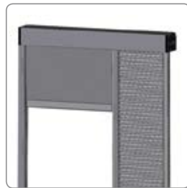
Buitenaanzicht Fixvent® met Nightcooling