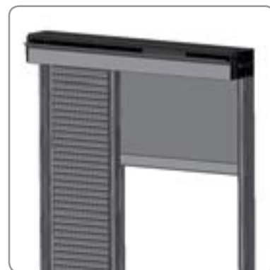
Binnenaanzicht Fixvent® met Nightcooling